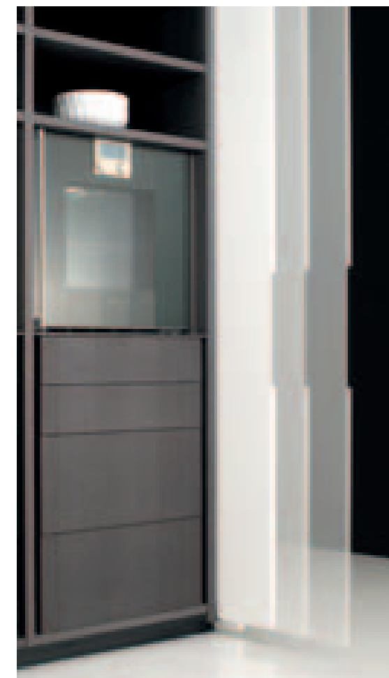
(in foto il forno è da cm.60)